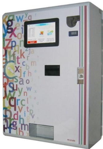
DRC10 fixation murale